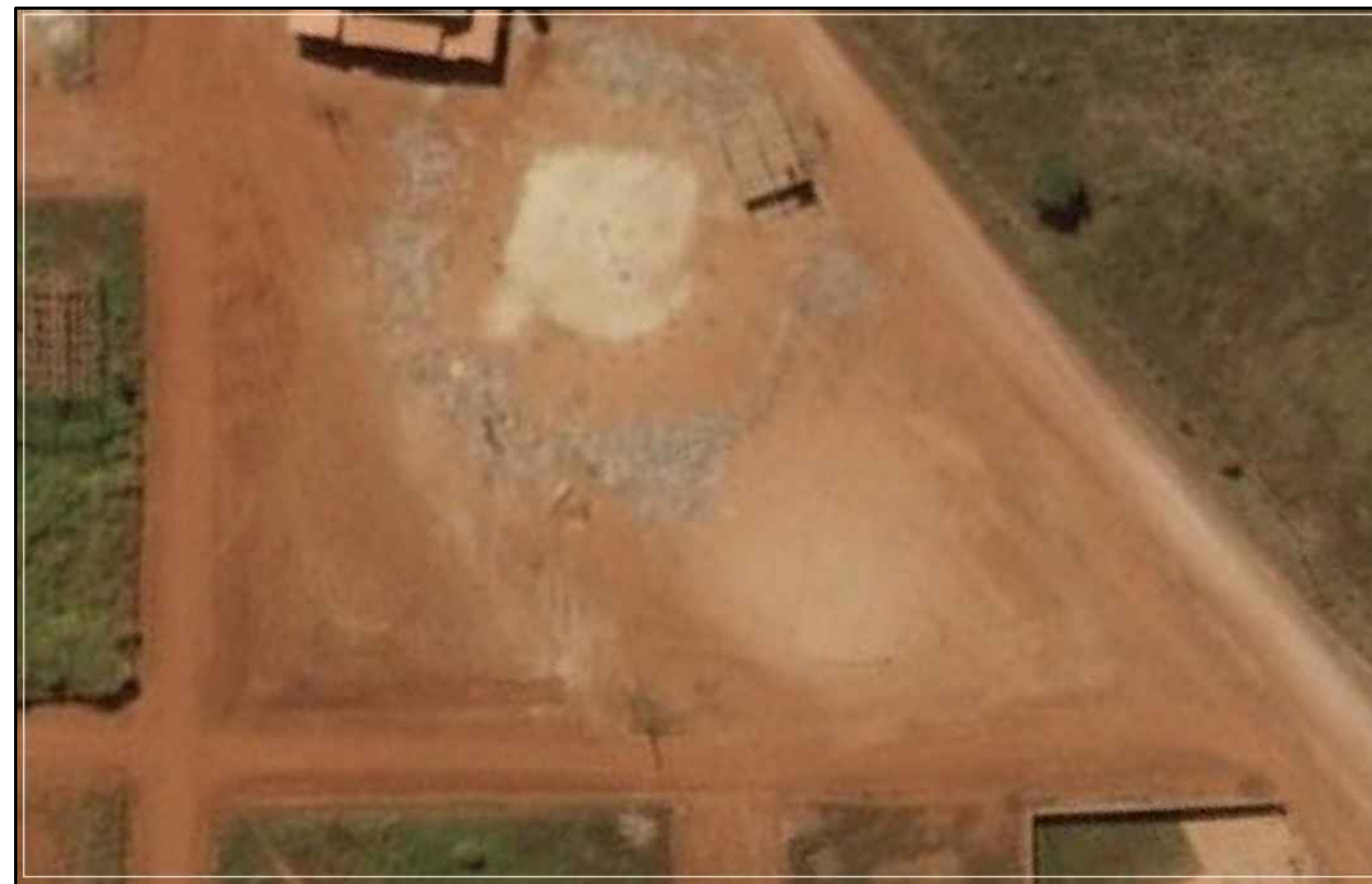
02 IMAGEM DE SATÉLITE DA INTERVENÇÃO 1:500