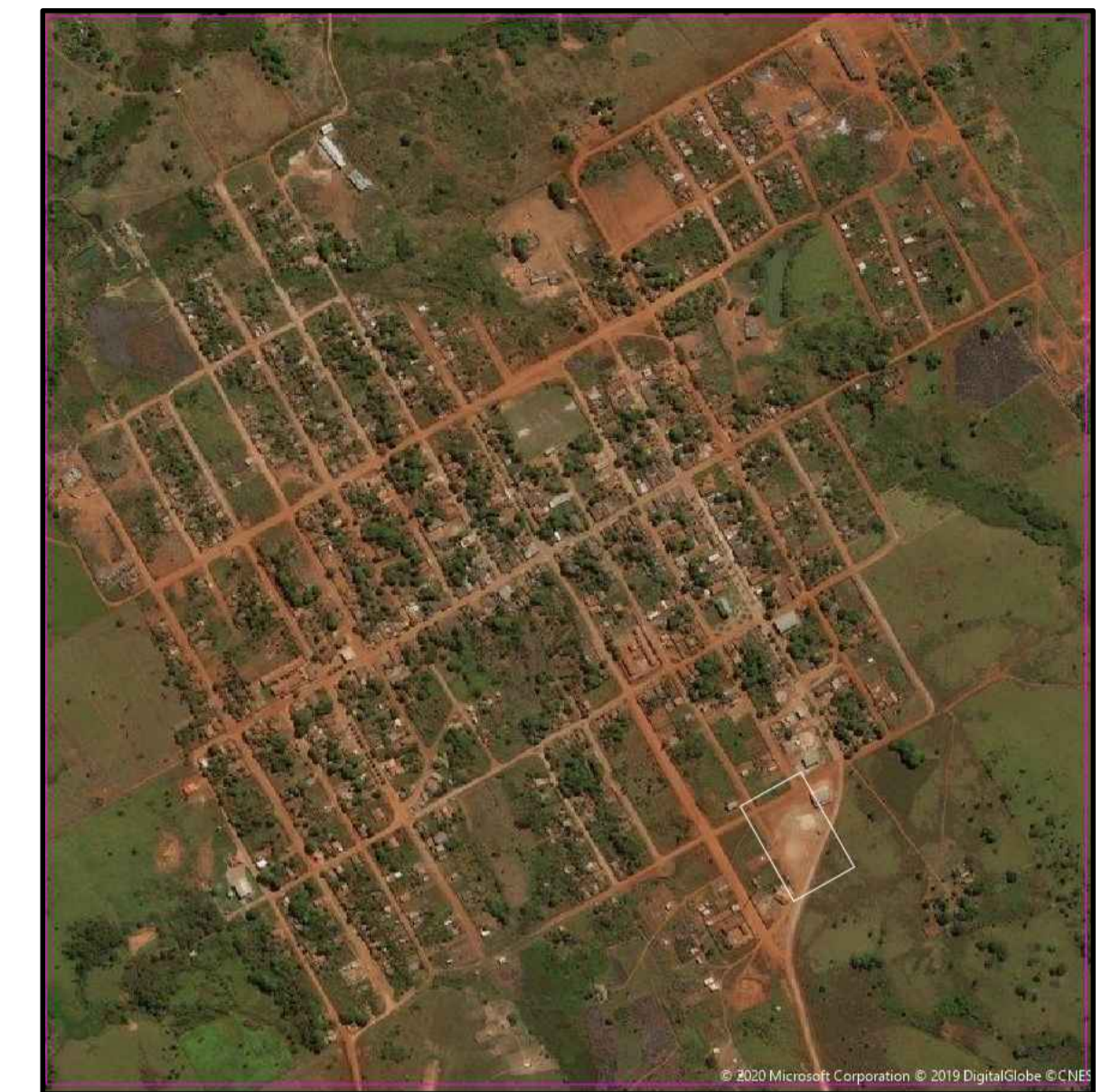
04 IMAGEM DE SATÉLITE DA CIDADE 1:10000