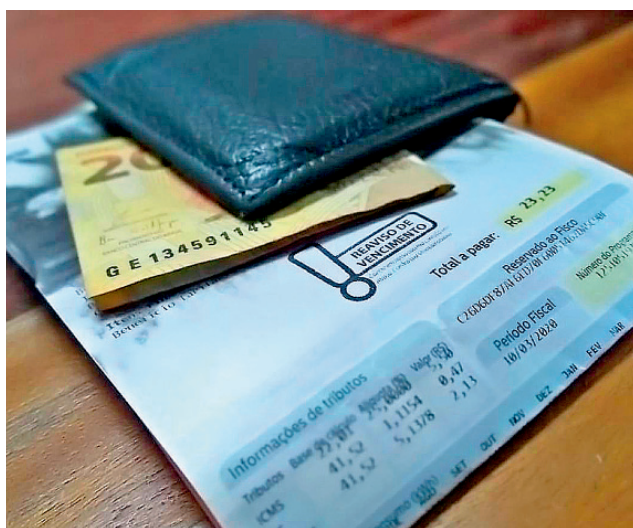
As tarifas da energia elétrica são impactadas pela alta do dólar

No domingo, o jornal Folha de S.Paulo publicou reportagem mostrando que só o custo de térmicas a diesel, que estão sendo acionadas para enfrentar a cri-