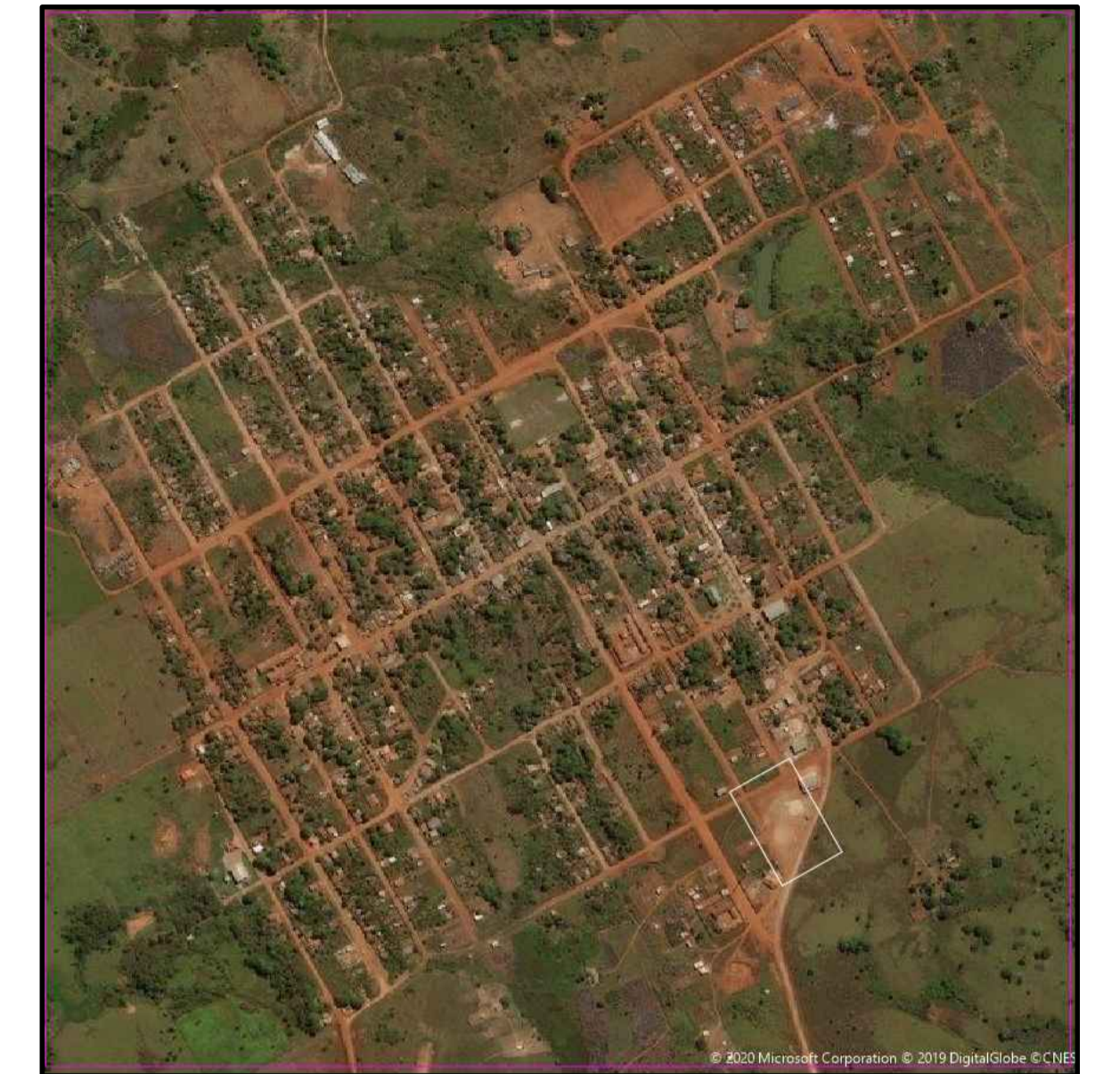
04 IMAGEM DE SATÉLITE DA CIDADE 1:10000