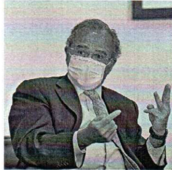
Paulo Guedes diz que o Renda Brasil será mais abrangente

A equipe econômica estuda propor uma reformulação em programas sociais para que o benefício médio do Renda Brasil - uma reformulação do Bolsa Família - seja de R$ 247 por família. Para isso, o governo deve propor o fim de programas como o abono salarial e o Farmácia Popular.