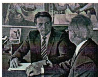
Bolsonaro assinou a prorrogação do programa por mais 2 meses

O presidente Jair Bolsonaro assinou nesta segunda-feira (24) decreto que prorroga por mais dois meses o programa de suspensão de contratos de trabalho e corte de jornada e salário.